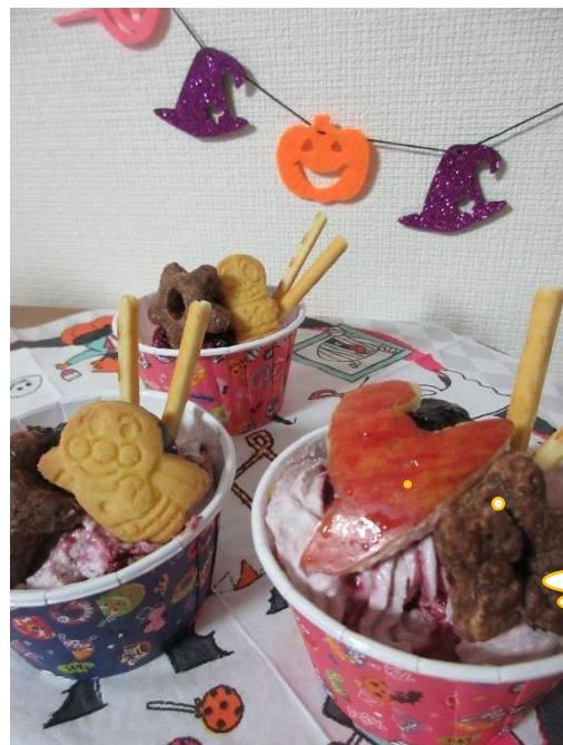
保育雑誌『Piccolo』を参考に