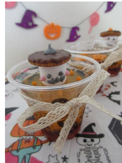
保育雑誌『Piccolo』を参考に